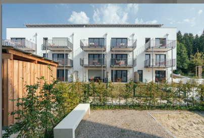
Rückansicht mit Gartenabteilen