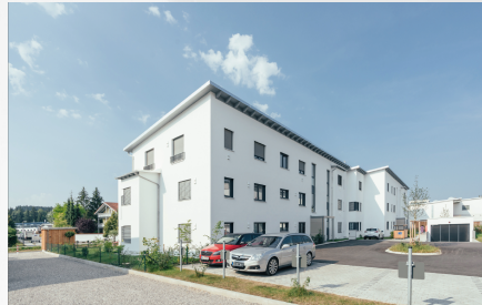
Ansicht Eingangsbereich mit Parkplätzen