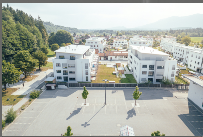
Komplettansicht von oben