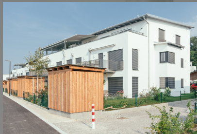
Rückansicht mit Gartenabteilen