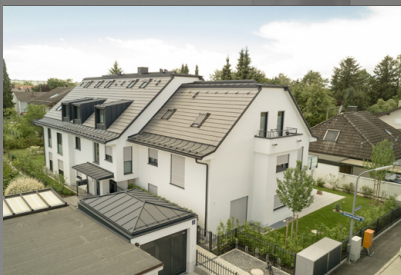
Ansicht von oben