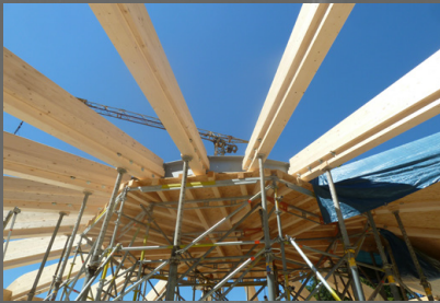
Ansicht Holzrahmenkonstruktion in Bauphase