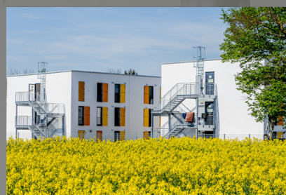
Seitenansicht mit Auf- und Abgang