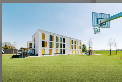
Seitenansicht mit Spielplatz