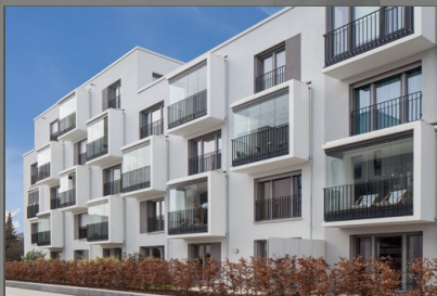
Balkonansicht vom Gehweg