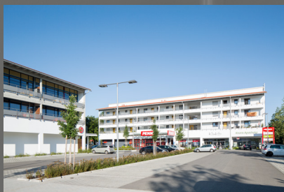
Ansicht mit Balkonen