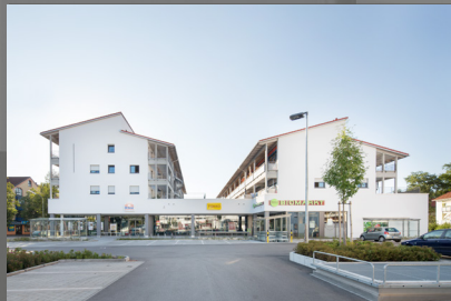
Seitenansicht beider Häuser